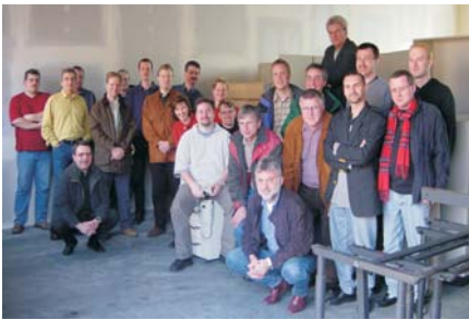
Das Team von Kühnle, Kopp und Kausch

Wie man für das Unternehmen wertschöpfend wirkt, dabei Menschen eine Freude machen kann und jede Menge Spaß hat, das zeigt das Beispiel des Frankenthaler Maschinenbauunternehmens AG Kühnle, Kopp & Kausch (KK&K).